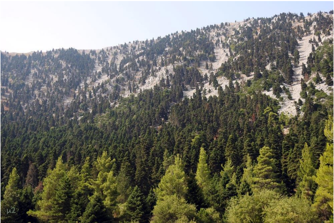
Άποψη του ελατοδάσους στις ανατολικές πλαγιές του όρους Κανδήλι (Σεπτέμβριος 2022).

συνιστούσε ωστόσο επ' ουδενί λόγω άσωτη σπατάλη κεφαλαίου. Ήταν οικονομικά αποδοτικότερη από κάθε άλλη εναλλακτική μέθοδο ανανέωσης της φυσικής γονιμότητας του εδάφους, ακριβώς γιατί έκανε ορθολογικότερη -από οικονομική τουλάχιστον σκοπιά- χρήση των διαθέσιμων παραγωγικών συντελεστών (Δημητριάδης 2018).