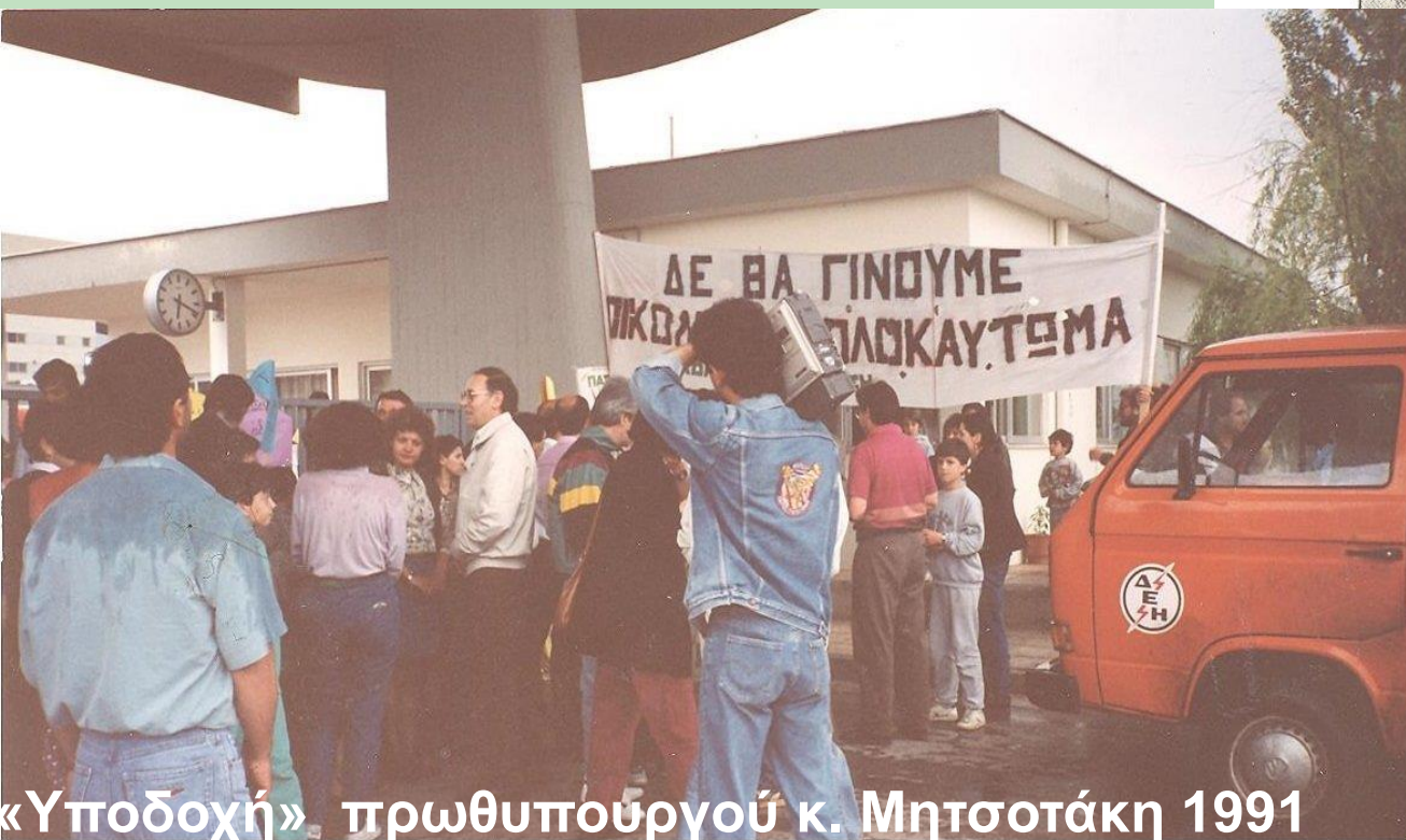
«Υποδοχή» πρωθυπουργού κ. Μητσοτάκη 1991